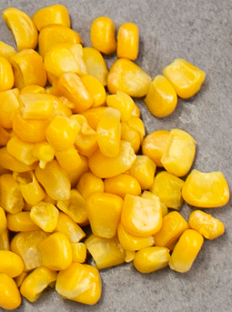
Majs 100 gram