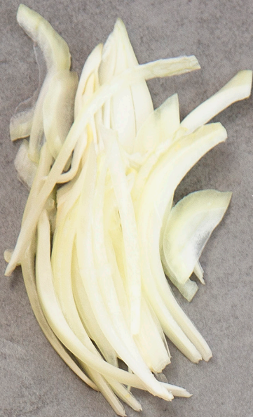
Lök 50 gram