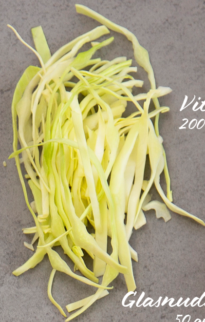
Vitkål 200 gram