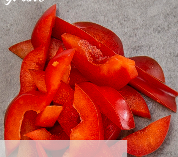
Paprika 200 gram