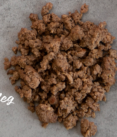
Köttfärs 500 gram

Våra studeranden visar hur det går till på TikTok: ya_osterbotten