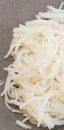
Glasnudlar 50 gram