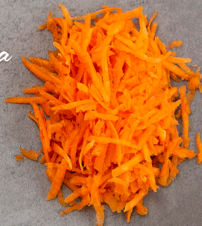
Morot 200 gram